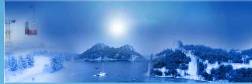
BAHAR 2010 II. KOL ULUDAĞ (BURSA) GÖZTEPE-II (İSTANBUL) HASEKİ (İSTANBUL)