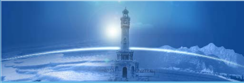
BAHAR 2010 I. KOL PAMUKKALE (DENİZLİ) EGE (İZMİR) AKDENİZ (ANTALYA)